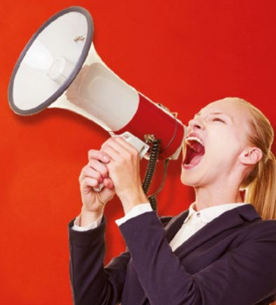
Sophie Karmasin, Familienministerin (ÖVP)

»Arbeitszeitflexibilisierung bietet Chancen für mehr Familienfreundlichkeit.«