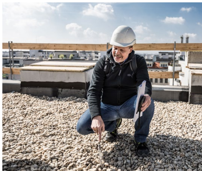
DER ARBEITSINSPEKTOR erklärt die Bedeutung des Anschlagpunktes am Dach. Er sei Teil des Sicherungssystems für spätere Reparatur- und Servicearbeiten an der fertigen Wohnhausanlage.

schüttung. An diesen werden später Seile und Einhängeösen montiert, um sich für Wartungsarbeiten daran gegen Absturz sichern zu können. Betreffend der Absturzsicherung am Dach meint der Arbeitsinspektor zum Polier: „Darüber müssen wir bei der Nachbesprechung noch reden. Erst vor zwei Wochen gab es damit einen Unfall auf einer anderen Baustelle. Die genaue Ursache ist zwar noch nicht geklärt, aber Vorsicht ist angebracht.“ Bauleiter Hemmer merkt an, dass solche Hinweise sehr wertvoll sind. Auf dem Rückweg dann eine Überraschung: Im siebenten Stock fehlt die erst kurz zuvor befestigte Sicherung des Kabelschachtes. Ein Arbeiter hat die provisorische Befestigung mittels Draht einfach abgezwickelt, die Palette