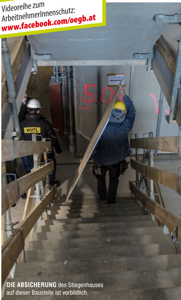
DIE ABSICHERUNG des Stiegenhauses auf dieser Baustelle ist vorbildlich.

Videoreihe zum ArbeitnehmerInnenschutz: www.facebook.com/oegb.at