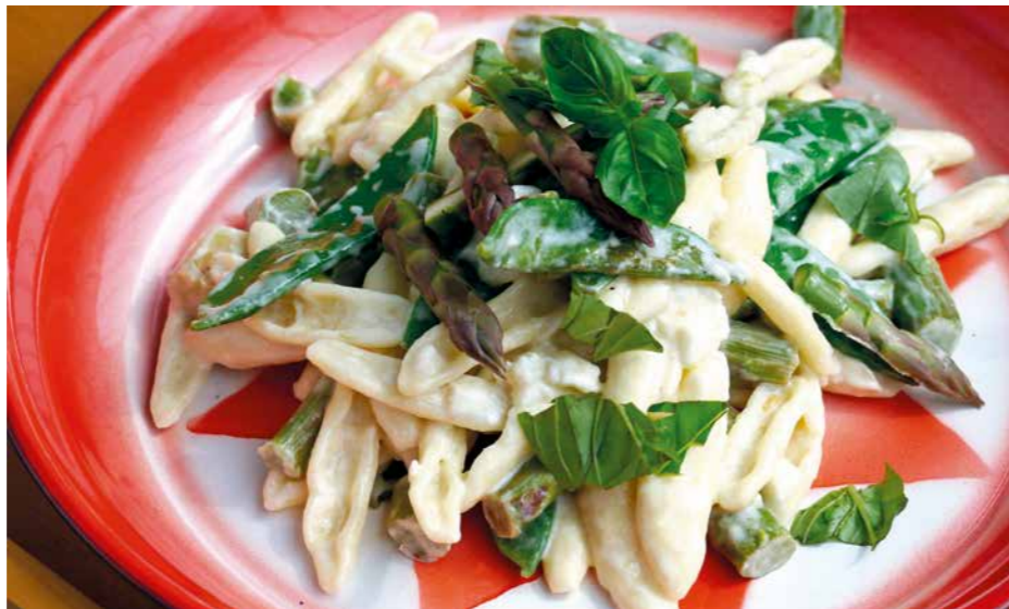
© Florian Kräfner, Illustration: Isabelle Carliouin

Essen fürs Picknick in der Sonne? Unterlage für ausschweifende Partys? Nudelsalat! Auch an den Arbeitsplatz lässt sich die „Pasta fredda“ natürlich gut transportieren. Heute in einer vegetarischen und Majo-freien Version. Mit grünem Spargel, der hat gerade Saison und schmeckt gemüsi-ger als der weiße. Nudeln laut Packungsanweisung kochen, aber zwei Minuten früher abgießen. Mit kaltem Wasser abschrecken.