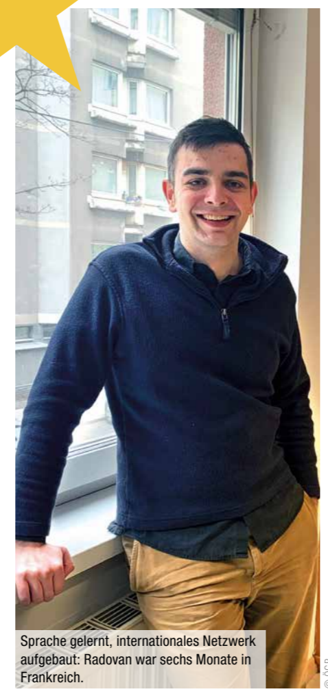
Sprache gelernt, internationales Netzwerk aufgebaut: Radovan war sechs Monate in Frankreich.

In einem anderen EU-Land zu studieren, ist kein großer Aufwand. Ein paar Formulare zur Anmeldung und los geht's. Radovan, 24, war innerhalb seines Journalismus-Studiums ein Semester in Nancy, Frankreich. Sein Ziel war vor allem, die Sprache zu lernen. Aber auch für die Karriere ist ein Erasmus-Aufenthalt förderlich. „Eine Studienkollegin ist nach Paris gegangen und schreibt dort jetzt für ein Modemagazin“, berichtet der Wiener, der sich bei seinem Eras-