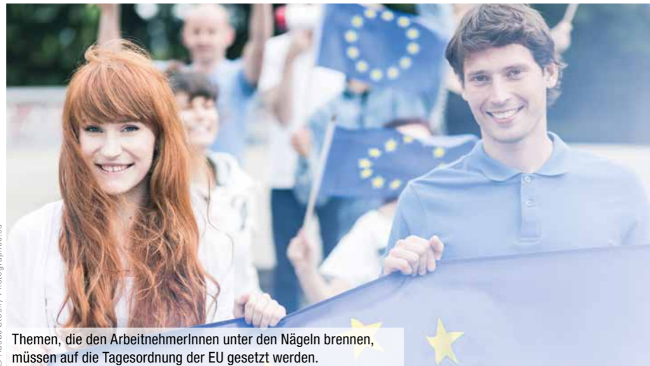
Themen, die den ArbeitnehmerInnen unter den Nägeln brennen, müssen auf die Tagesordnung der EU gesetzt werden.

Mit Unterstützung von EU-Abgeordneten konnten ArbeitnehmervertreterInnen in der EU einiges durchsetzen – gegen eine riesige Übermacht von Industriellen- und Finanzlobby.