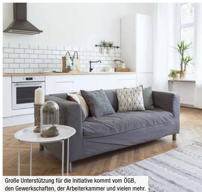
Große Unterstützung für die Initiative kommt vom ÖGB, den Gewerkschaften, der Arbeiterkammer und vielen mehr.

Europäische Bürgerinitiative gegründet – jetzt unterschreiben!